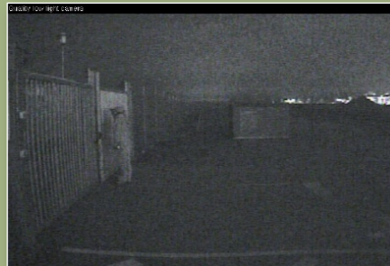
4. kép: Bal oldal: kiváló fényérzékenységű analóg kamera, jobb oldal AXIS Q1602 lightfinder technológiájú kamera

Az infra megvilágítók mellett léteznek természetesen a fehér fényű megvilágítók is, amelyek kiválasztására lényegében