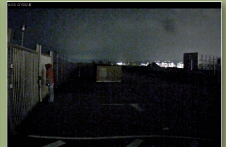
5. kép: bal oldal: túl szűk, jobb oldal túl széles megvilágítás